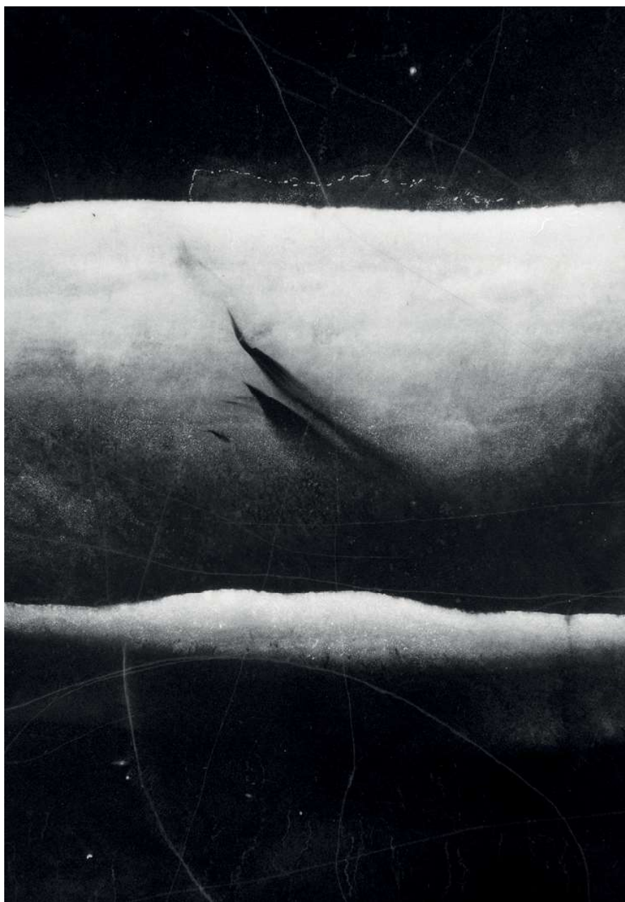
Painted by Miro.

Start je drone, laat hem vervolgens een tijdje stilstaan en let op je controller om er zeker van te zijn dat de temperatuur in de batterijen goed is. Ga pas omhoog als ze boven de 20 °C zijn. Vlieg niet te snel, dan koelen de batterijen veel sneller af.