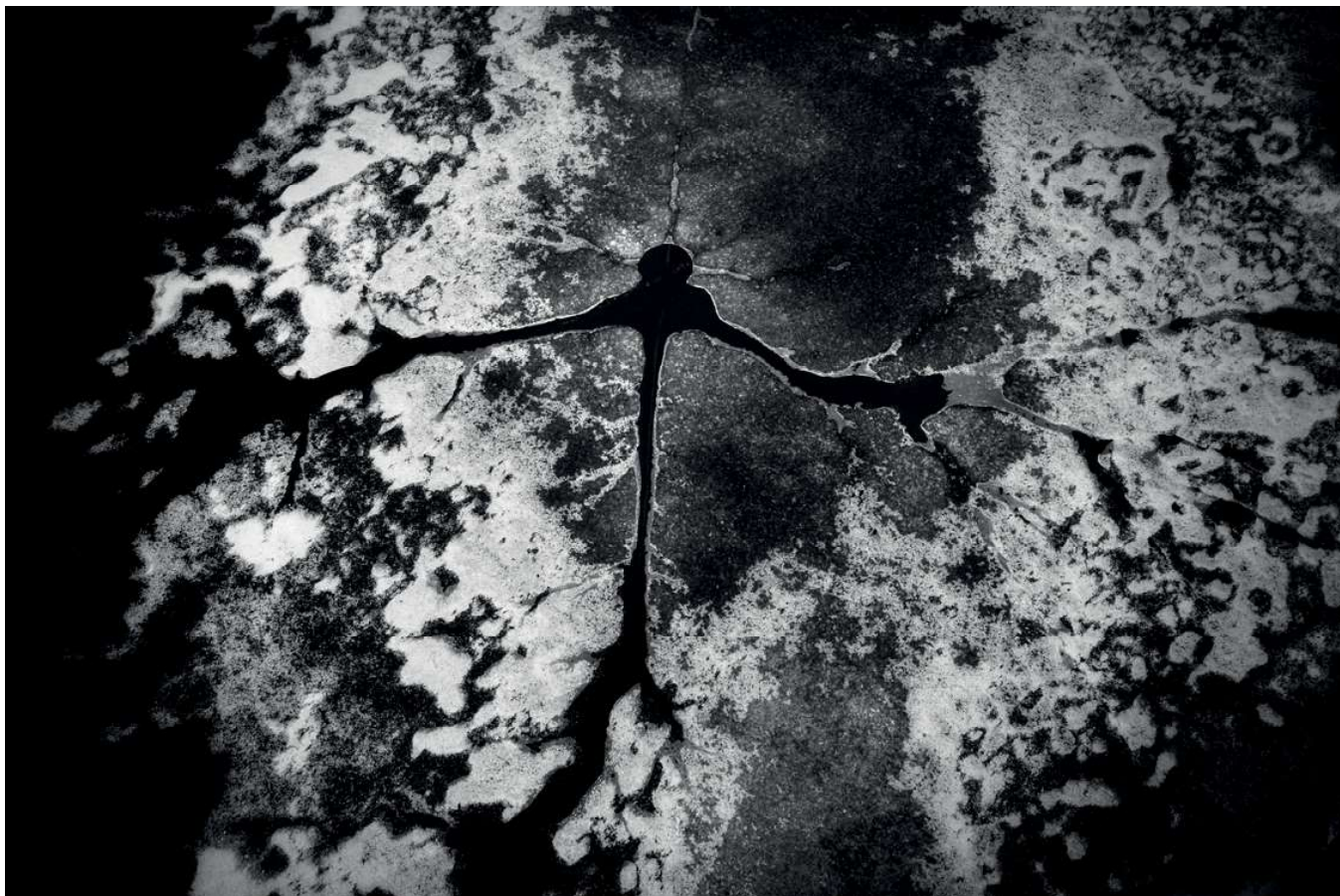
Fotografie was voor mij door de jaren heen onbedoeld een soort therapie. Als ik met mijn camera in het bos ben, vergeet ik tijd en plaats volledig en kom ik in een staat van flow. Op de een of andere manier kanaliseer ik mijn zorgen en problemen in mijn foto's, waardoor ze er vaak donker en 'moody' uitzien.

Ik heb verschillende artikelen over White gelezen. Hij leerde zijn studenten om beelden te benaderen met de kalmte en focus van meditatie, en te vertrouwen op het onderliggende mentale proces. De titel 'The sound of one hand' is een beroemd zenboeddhistisch raadsel. De kijk van het zenboeddhisme op kunst rond de eeuwwisseling verschilde sterk van de traditionele kunst. In het Westen probeerden kunstenaars natuurgevouwen afbeeldingen te maken, terwijl men in de oosterse traditie een sfeer schilderde. Ik was dus, onbewust, al jaren bezig met fotograferen volgens de oosterse traditie. Mijn stemming heeft altijd mijn beeld beïnvloed.