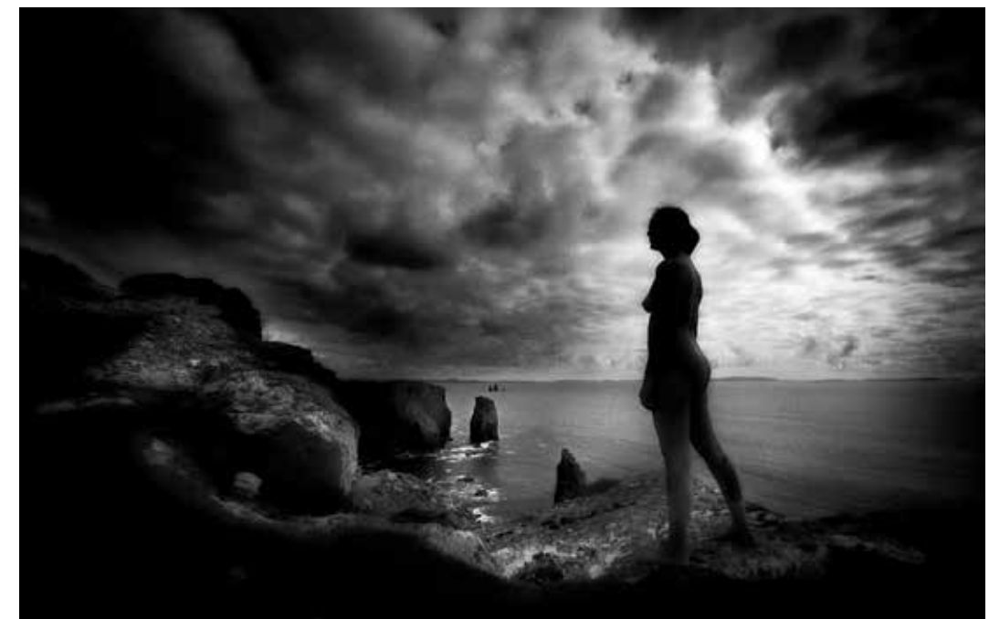
Utsikt til The Drongs, Shetland.