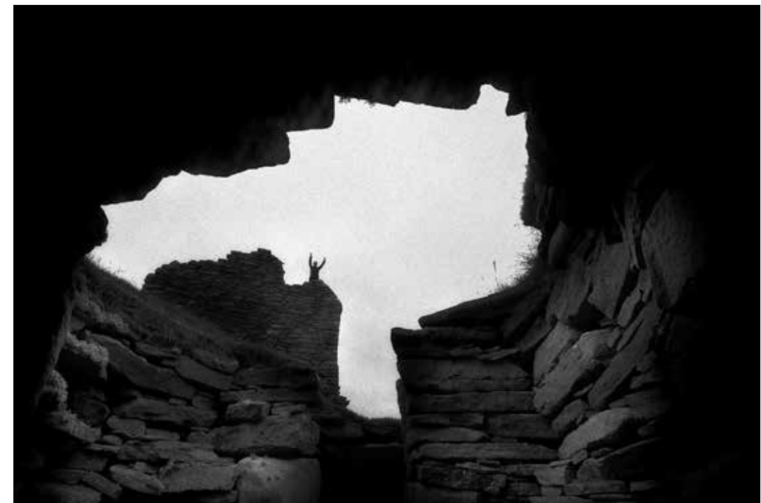
Borgen på Jarlshof, Shetland.