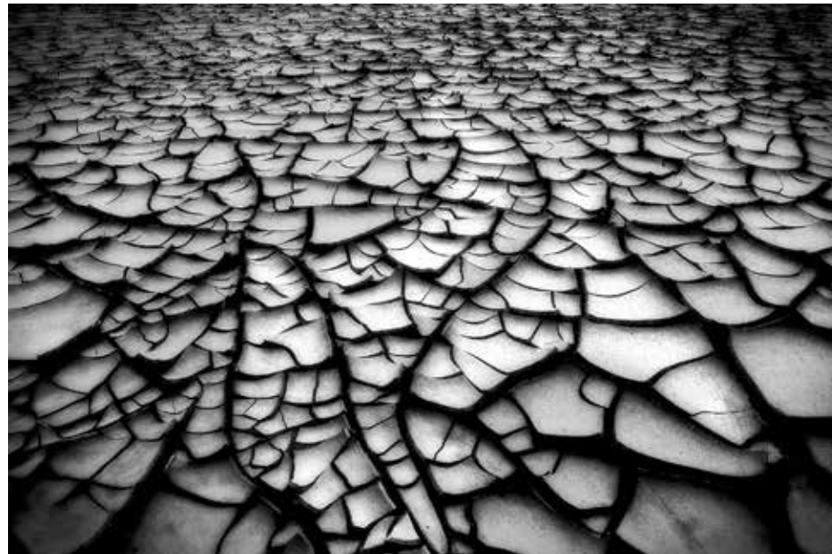
Krakerlert landskap ved Hverir, nord på Island.

Kerlingarfjöll var området som gjorde sterkest inntrykk på oss begge. Vær og vind ble litt i tøffeste laget, og plutselig stod vi der med en Nikon og en Canon som ikke ville samarbeide. Bakken kokte, det stinket svovel og det blåste så jeg holdt på å gå overende. Men de bildene vi fikk med hjem var verdt det. Turen rundt Myrdalsjökull ble også et minne for livet. Her fikk vi testet bilen på grusveier, veier som blåste bort, veier som forsvant i vannet og veier som var dekket av lavastein. Hele turen tok omtrent fire timer, og da vi kom ut på hovedveien igjen dukket det opp en liten fjellrev som svinset foran oss, litt distré på veien, før han forsvant innover vidda.