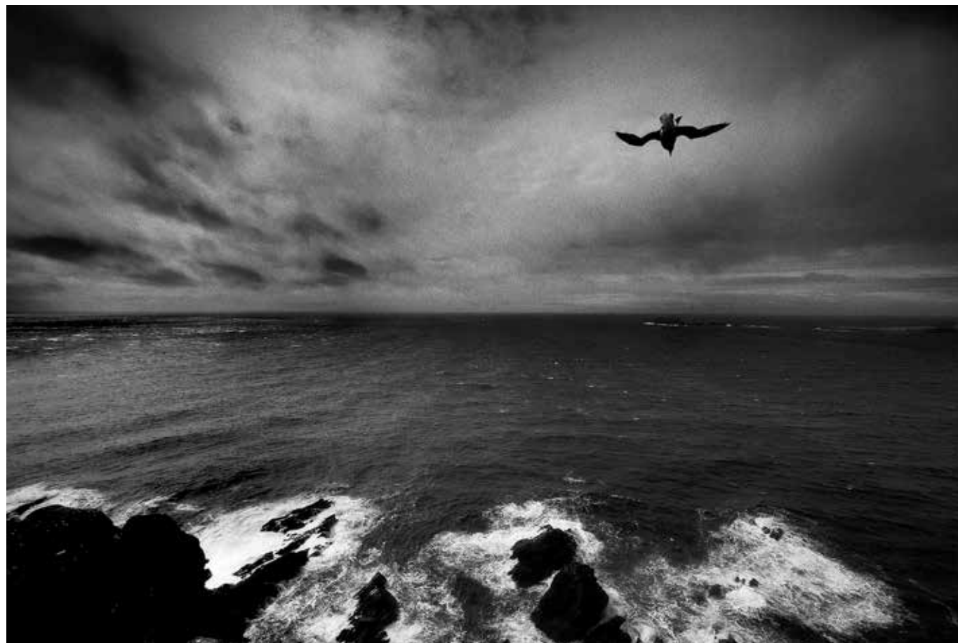
Sittende på stupkanten ved Sumburgh, Shetland.